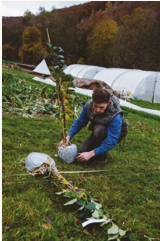
↑ Baum für Baum zu mehr Biodiversität.

Vermutlich hast du schon gehört, dass die Landwirtschaft vor einigen richtig großen Problemen steht: Klimakrise, Biodiversitätsverlust, Landflucht ... So richtig rosig schaut es nicht aus. Und auch wenn zum jetzigen Zeitpunkt Optimismus noch zu weit gegriffen wäre, habe ich doch im Moment das Gefühl, dass sich etwas verändert. Die Neugründungen von Solawis gehen