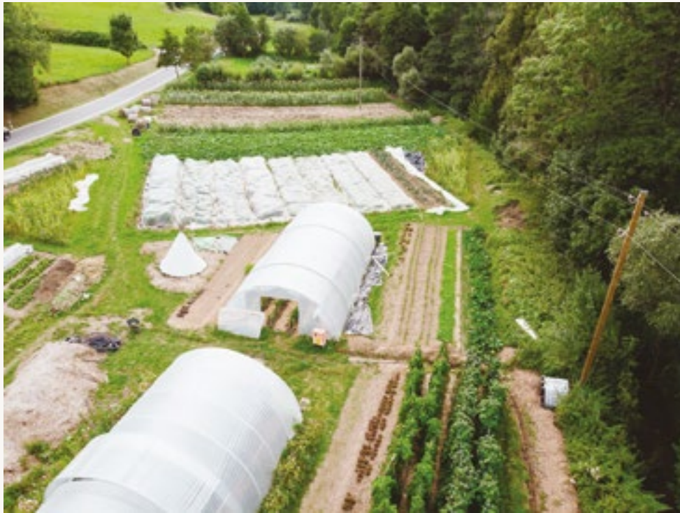
↑ Die Gemüseinsel von oben: kleine Flächen, aber richtig fette Ernteerträge.

Verglichen mit der Praxis wird dir vielleicht auffallen, dass die modernen Marktgärtnerei-Betriebe in Wahrheit ganz anders aussehen, obwohl sie biointensive Methoden anwenden. Das liegt daran, dass diese 8-Punkte-Strategie nicht den Fokus auf westliche Erwerbsbetriebe legt, sondern auf Subsistenz- und Selbstversorgungsbetriebe. Und somit in dieser Form hauptsächlich in den Ländern des Globalen Südens und Freizeitgärten genutzt wird. Das Problem an Erwerbsbetrieben ist nämlich, dass es einen sehr großen Abfluss an Nährstoffen gibt, sobald Gemüse verkauft wird. Aus diesem Grund ist es nicht möglich, einen geschlossenen Betriebskreislauf, wie er beim biointensiven Ansatz angestrebt wird, umzusetzen. Einige Aspekte fallen auch aus dem Konzept heraus, da sie sich ökonomisch als nicht sinnvoll erweisen. Beispielsweise Punkt 5, die Kohlenstoffeffizienz: Der Anbau von Getreide auf kleiner Fläche ist eben nur sinnvoll, wenn er der eigenen Versorgung dienen soll. Denn mit den Preisen der Supermärkte und des Großhandels können wir nicht mithalten. Andere Punkte, wie zum Beispiel das Kompostieren, nehmen wiederum eine sehr viel größere Rolle ein. Doch wenn du dir die Mengeneempfehlungen an Kompost anschaut, die in den Büchern der Marktgärtnerei-Bewe-